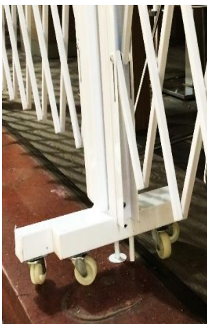
Skjutregel i fjädrande golvhylsor. Lås mot vägg.