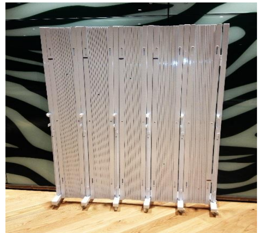
Förvaring 28 cm/längdmeter