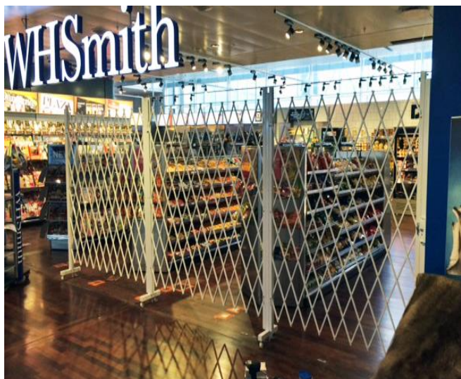
Hörnlösning - totallängd 8,6M